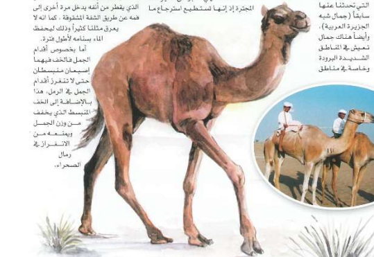
5 على خطى صقار - الملحق (1)

صفات الجمال العامة: يتميز الجمال بقدرته على تخزين الماء مدة طويلة جداً وقد لا يشرب الماء لمدة ١٠ أشهر، وذلك لأنه يودع بداخله ثلاث معدات لذلك فهي تعتبر من الحيوانات الجيزة إذ إنها تستطيع استرجاع ما شربها من الماء في وقت لاحق.