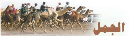
5 على خطى صقار - الملحق (1)

عدنية، جدي يا والدي عن الصحرانا الأبي، الصحران لغز ساحر. عدنية، كيف تكون الصحران لغزاً وأنا أناها؟ الأبي، لأيتها تخلف من بين الآخرين. عدنية، زدت من حورتي يا أباي. الأبي (يضحك) تصبح الصحران أجماً جملان صريحاً ويرى لأجاً فيها وأيضاً تصيح عذاتناضاً بالجماء والأوتان والخير الوبير. عدنية، وكيف أراها بعيدة؟ الأبي (يصرخ) كنت أراها أرضاً حية ملته بالخير والعماء. عدنية، والأبلا. الأبي، لم تعد كذلك. عدنية، بولانا لم تعد كذلك. الأبي، اختل التوازن بين أركانها عدنية، وماهي أركانها الأبي، رمل ومطر. ونبات وجوان ويشتر عدنية، وكيف يكون هذا التوازن الأبي، حين يحترم البشر قوانين الطبيعة فلا يعتدوا على مخلوقات الله ولا يسيروا في استهلاك موارده الطبيعية. عدنية، وكيف أصل البشر واعتدوا على الحياة في الصحران. الأبي، بعد الماء الجوفية حتى أصبحت خصبة، فزعم البشر أنهم أتوا من الأرض على أنواع عديدة من النباتات. فحين الماء لتأكل ويدين تلك الأنواع الحيوانات التي في الصحران هذه الأركان عبارة عن حافة متكامل كل ركن فيها يعتمد على غيره ماء حيات -جوان- الأرض البشر شادي الصحران الحية وطيقة بالخير الكثير. عدنية، وهل هناك أمل في أن تعود أمل في أن تعود الصحران كما كانت؟ الأبي، نعم. وذلك حين تأخذ بمقدار وتحترم حق باقي المخلوقات في الحياة والبقاء ملقاً. حينها فقط ستعود الصحران جميلة كما كانت. عدنية، أساسيات ما يأسى لشعوب الصحران الأبي، نحن وجدنا لكيفية بدينية عدنية، أليس لهم أن يبدوا وأن يضيف معنا الأبي، بل إنهم. الأبي، وكنتنا على الله.