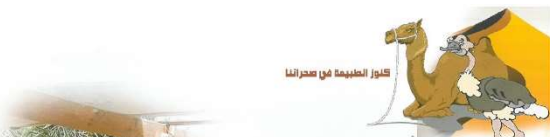
6 على خطى صقار - الملحق (1)

النعامة النعام هو الطائر الوحيد يابسين فقط ويعيش في سهول إفريقيا، والنعامة غير قادرة على الطيران ولكنها تجري بسرعة فائقة تبلغ ٤٠ كيلو متراً في الساعة وهي أسرع من جمل بحري، وتستطيع أن تركض بسرعة ٤٥ كم في الساعة دون غناء أو صوت، الطيور يعيش النعام أكبر من أي بيضة أخرى، أكبر من بيضة الدجاج و ٢٤ مرة، وفترتها قوية جداً وسكنها عام ١٩٥٠م.