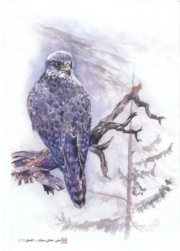
١٥ على خطى صقار - الملحق (١)